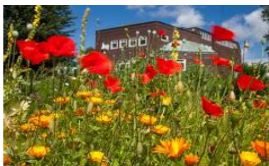
NOLDE MUSEUM TYSKLAND