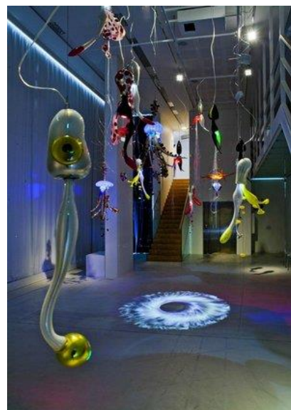
GLASMUSEET I EBELTOFT