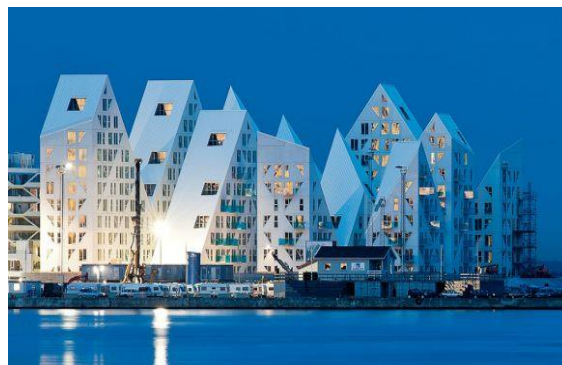
ARKITEKTBSÖK ISBJERGET AARHUS