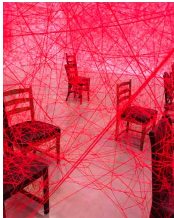
Chiharu Shiota, The Distance , 2018. Foto: Margret Jönsson © Chiharu Shiota BUS 2018