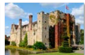
Hever Castle