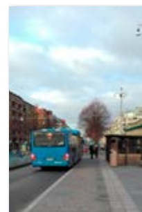
Missa inte bussen!

ANMÄLAN: Senast 20 maj BETALNING: Senast 27 maj