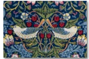
William Morris, Strawberry Thief (jordbaertyv), 1883. Humlebaeck

ANMÄLAN: Senast 25 mars BETALNING: Senast 1 april