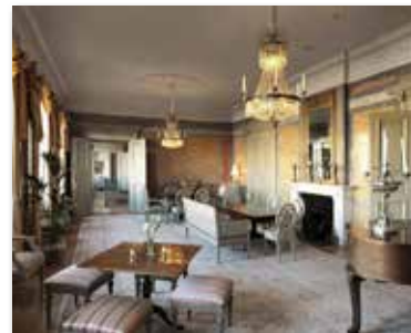
Foto: Marmorsalongen, Chalmerska Huset