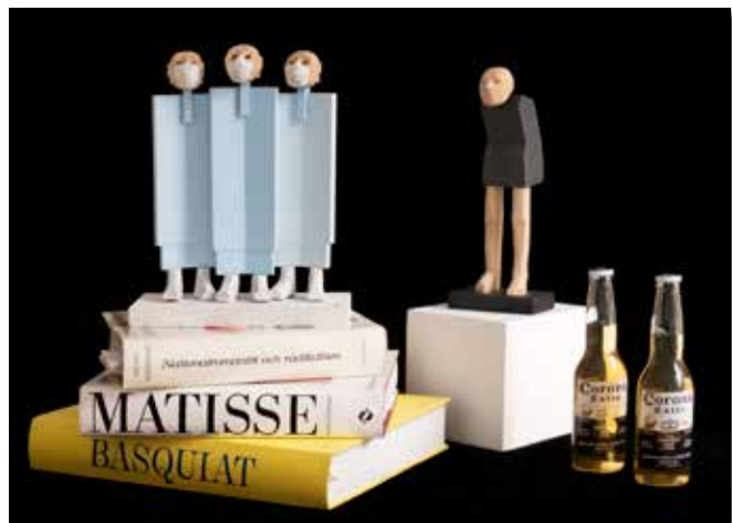
Skulpturer av Pieter Hybbinette foto Hillevi Nagel

Hux flux var vi förvandlade från pigga pensionärer till utsatta äldre och ingick i riskgruppen av 70-plussare. Detta gällde nästan hela Konstföreningens styrelse, som nu var påbudna att stanna hemma och avhålla sig från sociala kontakter. Då fanns ingen annan möjlighet än att ställa in säsongens kvarvarande programpunkter och skjuta på utställningarna som var kvar på framtiden. Parkera sig minst två meter från teven och nogsamt hörsamma Folkhälsomyndighetens rekommendationer.