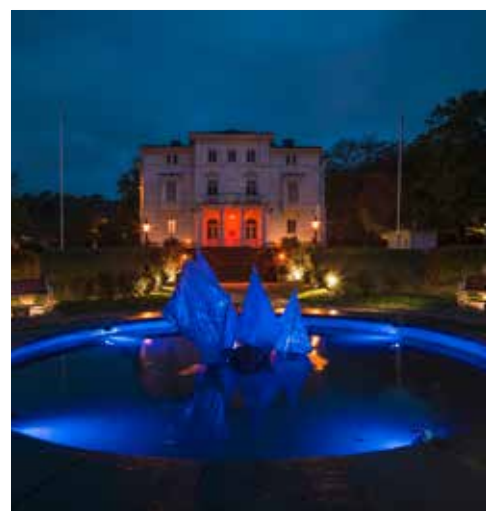
foto Lights in Alingsås

Mer info på: www.lightsinalingsas.se Vid frågor kontakta kansliet Lokaltåg går till Alingsås Station från Göteborgs Centralstation. För de som åker bil finns flera parkeringsplatser nära promenadstarten. Vid frågor kontakta Kansliet eller se www.lightsinalingsas.se